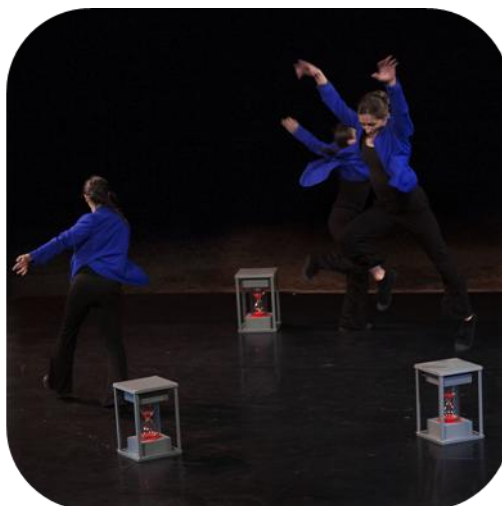
Teaser version plateau

Pour la version plateau, par choix artistique, le musicien n'est pas sur scène. Autant il est indispensable qu'il soit présent dans la version rue parce que le côté visuel de la vielle et son utilisation modernisée participent à la curiosité et l'écoute du public, autant les manipulations nombreuses et nécessaires que doit faire le musicien entre l'ordinateur, la pédale et l'instrument parasiteraient l'effet visuel escompté sur scène. Cependant, la création musicale est utilisée en bande son.